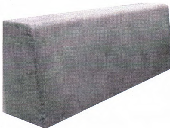
Figura 2 - Meio Fio.