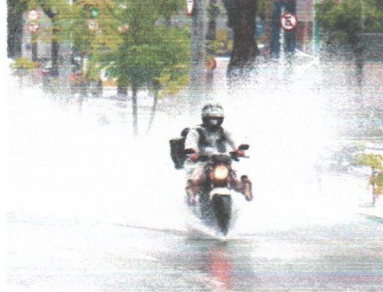
TODAS as macrorregiões foram beneficiadas

As chuvvas do Ceará ficaram acima da média no trimestre de fevereiro a abril de 2020. Com 25% a mais nos acumulados de precipitação, os resultados foram os melhores desde 2009, quando o trimestre registrou um desvio positivo de 42% acima da normal climatológica para o período, que é de 510,1 milímetros. Na época, foram alcançados 725,6 milímetros, enquanto neste ano, o acumulado registrado foi de 652,6 milímetros. Os dados foram apresentados ontem pela Fundação Cearense de Meteorologia e Recursos Hídricos (Funceme), por meio de transmissão ao vivo no Instagram.