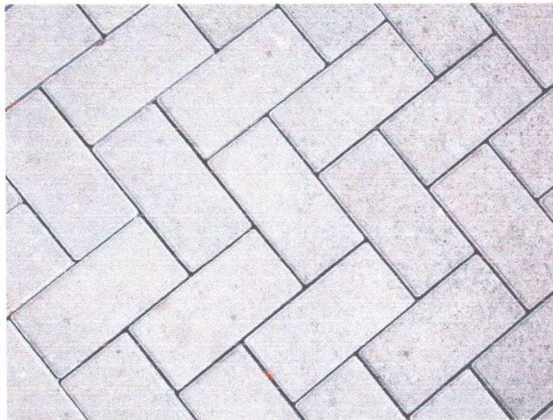
Figura 1 - Modelo do Piso Intertravado.